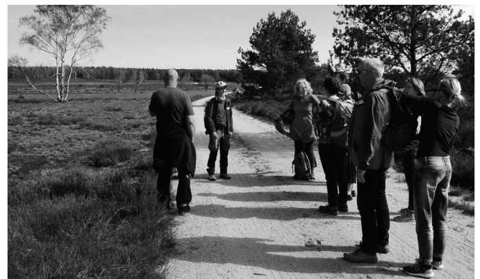
Landschaftsführung in der Heidelandschaft bei Kraupe

Die LEADER-Regionen Dresdner Heidebogen und Elbe-Röder-Dreieck bieten ab März 2026 einen Lehrgang zu „Zertifizierten Natur- und Landschaftsführer/-innen“ (ZNL) an.